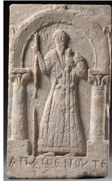
Stèle représentant Apa Shenoute. Sohag (Egypte), Ve siècle. Calcaire. Skulpturensammlung und Museum für Byzantinische Kunst, Staatliche Museen zu Berlin.

Au Ve siècle, suite aux conciles d'Ephèse et de Chalcédoine et aux questions sur la nature du Christ, la chrétienté orientale se fragmente ; et au VIIe siècle la naissance de l'islam puis son expansion rapide vont donner forme durablement à un univers musulman dans lequel est enclavé un monde chrétien. Les chrétiens sont « dhimmis », protégés – euphémisme qui tait leur statut de citoyens inférieurs. Mais leur rôle dans la vie publique est central, et les Eglises orientales se développent. En témoignent à l'époque médiévale les édifices qui se construisent et se décorent ( Vierge à l'Enfant , peinture à fresque d'une église de Beyrouth, XIIe siècle) et une abondante production de manuscrits en arabe, syriaque, grec, arabe carchouni, etc. Ils propagent écrits théologiques, liturgiques, bibliques. Ils sont souvent enluminés ( Vierge allaitant , Egypte, Xe siècle). Car au sein d'un islam qui interdit l'image, et après la crise iconoclaste byzantine, les chrétiens d'Orient sont de fervents peintres d'images. En matière d'ornements les influences entre arts chrétien et islamique sont réciproques : un Pentateuque peut adopter une ornementation typiquement coranique (Egypte, 1353).