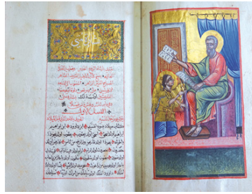
Evangile arabe. Illustré par Neme al-Musawwir (attri.), Syrie, 1675. Manuscrit.

Dès le Ier siècle les marches orientales de l'Empire romain se christianisent. L'art se convertit lui aussi. Les églises sont ornées de fresques, de mosaïques, de sculptures. Les fresques de Doura-Europos, en Syrie, datent du IIIe siècle. Elles sont frustes, presque des graffitis colorés. On y reconnaît Jésus disant au paralytique de rentrer chez lui, ce qu'il fait, son lit sur le dos. Dans les siècles suivants, tandis qu'en Europe se développe la civilisation mérovingienne, l'Orient est influencé par Byzance : sur un ivoire sculpté (VIe siècle) le Christ est encore imberbe. Tel un manuscrit impérial, le Codex sinopensis (VIe siècle) est écrit en grec à l'or sur parchemin teint de pourpre : une illustration montre la guérison des deux aveugles de Jéricho. De la même époque datent les célèbres Evangelies de Rabbula (Rabbula était le copiste), manuscrit en syriaque richement enluminé.